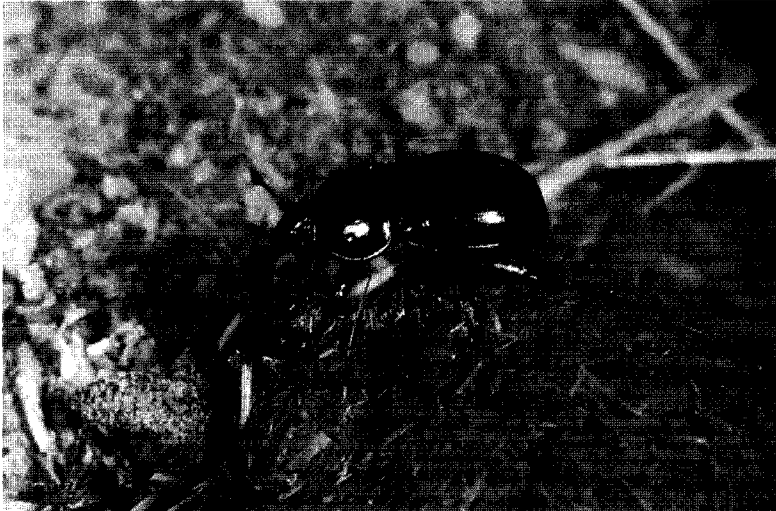
PHOTO 4 : Trypocopris vernalis : ce coléoptère se rencontre dans les milieux ouverts et secs ; il fréquente les crottes de brebis, de renards et de chiens ; on le trouve également sur les crottins de cheval et les bouses.

PICTURE 4 : Trypocopris vernalis : this Coleoptera is to be found in open and dry environments, frequently in the faeces of ewes, foxes and dogs, also in those of horses and cattle.