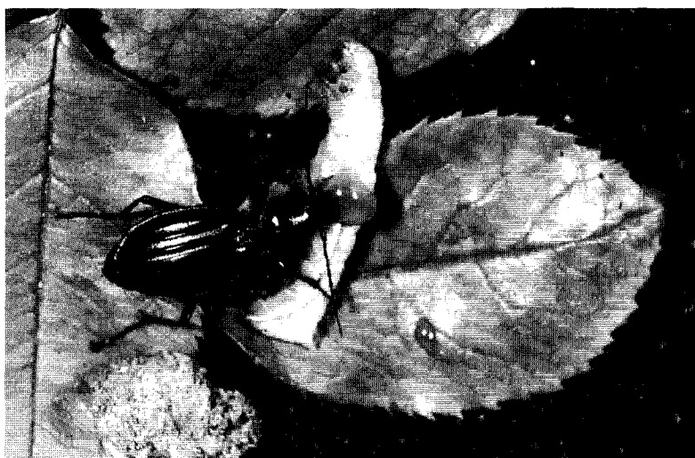
PHOTO 1 : Carabus auratus , le Carabe doré, est un redoutable prédateur des limaces et escargots.

L'écosystème «prairie permanente» (prairie humide ou pelouse sèche), et le système de haies et d'arbres plus ou moins isolés qui l'accompagne, sont une formidable source de diversité biologique. La faune entomologique y sera d'autant plus riche que la flore y est diversifiée. Cela dépend, bien évidemment, de la conjonction de facteurs écologiques (sol/climat) et de l'usage qui est fait de ces forma-