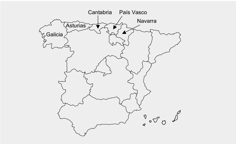
FIGURE 1 : Communautés Autonomes formant "l'Espagne Verte".

La température moyenne annuelle varie de 8,3°C (point culminant à l'intérieur des terres) à 16,0°C sur la cote sud-ouest. La température moyenne du mois le plus froid oscille entre 2,2 et 11,7°C, tandis que celle du mois le plus chaud varie entre 15,4 et 22,6°C. La pluviométrie est relativement élevée, surtout quand on la compare avec le reste de l'Espagne. Elle varie entre 700 et plus de 2 000 mm par an en moyenne, selon l'endroit. Cependant, les pluies sont concentrées sur la fin de l'automne, l'hiver et le printemps. La sécheresse estivale dure entre 3 et 5 mois, ce qui fait de la Galice un territoire au climat océanique à forte composante méditerranéenne .