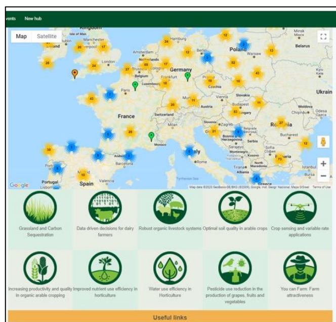
Figure 3 - L'inventaire européen des fermes de démonstration et les thèmes NEFERTITI

En 2017, la Commission Européenne a accordé un financement de 7 millions d'euros pour le projet NEFERTITI (Networking European Farms to Enhance Cross Fertilisation and Innovation Uptake Through demonstration) dont l'objectif principal est de mettre en œuvre les bonnes pratiques de démonstration dans un réseau de fermes commerciales issu de l'inventaire de PLAID et AGRIDEMO (figure 3).