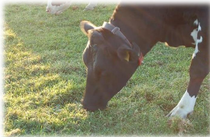
Pâturage Max 1 semaine