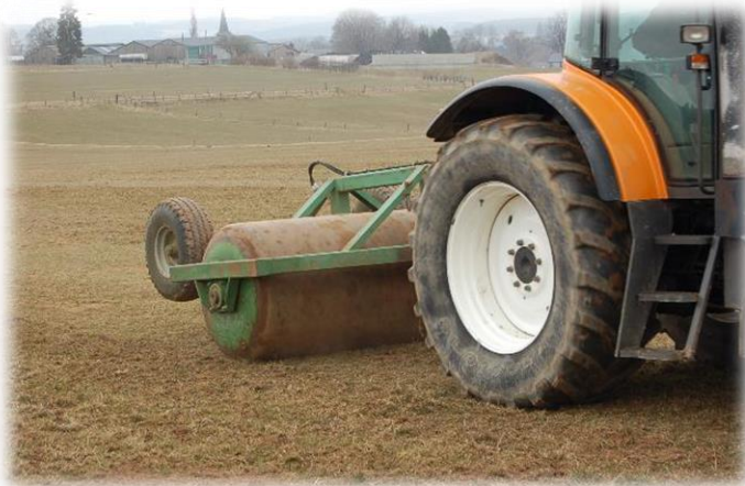
Rouleau lourd lisse ou crénelé