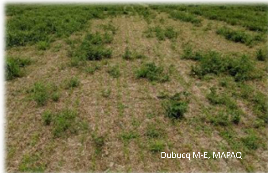
Dubucq M-E, MAPAQ