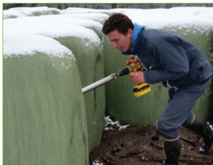
Figure 3 : Prélèvement sur balle fermée à l'aide d'une sonde

Les prélèvements simples sont ensuite rassemblés, homogénéisés pour obtenir un échantillon représentatif d'environ 500 g frais.