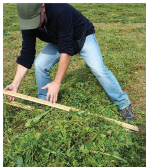
Figure 1 : Prélèvement sur l'andain à l'aide d'une pince

Regrouper les échantillons simples, mélanger et sous échantillonner pour obtenir l'échantillon représentatif d'au moins 1 kg frais.