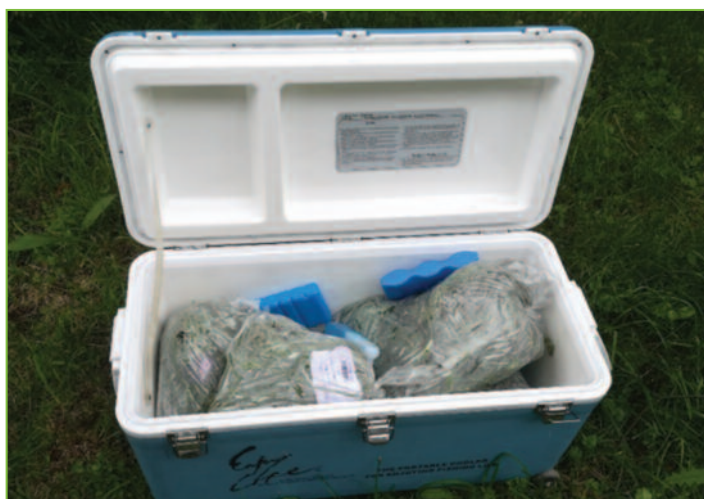
Figure 4 : Stockage et étiquetage d'un échantillon

Il est possible d'envoyer l'échantillon séché et broyé au laboratoire. Il est recommandé de sécher les échantillons frais à 60°C maximum pendant 72h. Les échantillons sont généralement broyés à 1 mm pour les analyses.