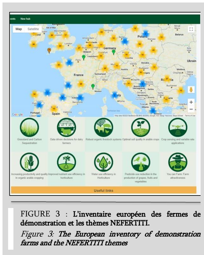
FIGURE 3 : L'inventaire européen des fermes de démonstration et les thèmes NEFERTITI.

En 2017, la Commission Européenne a accordé un financement de 7 millions d'euros pour le projet NEFERTITI (Networking European Farms to Enhance Cross Fertilisation and Innovation Uptake Through demonstration) dont l'objectif principal est de mettre en œuvre les bonnes pratiques de démonstration dans un réseau de fermes commerciales issu de l'inventaire de PLAID et AGRIDEMO (Figure 3).