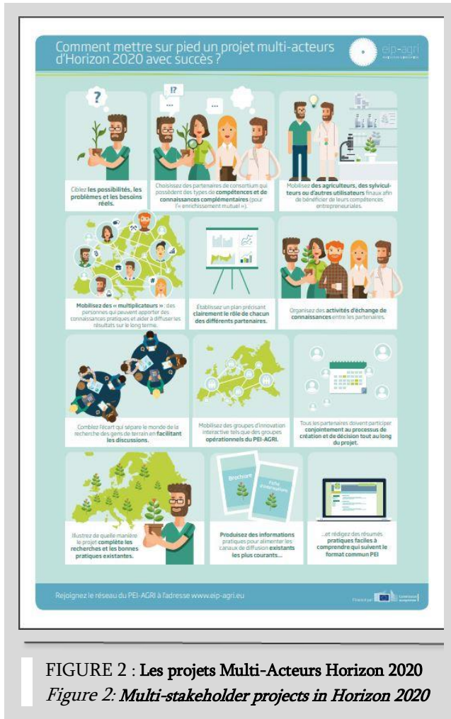
FIGURE 2 : Les projets Multi-Acteurs Horizon 2020 Figure 2: Multi-stakeholder projects in Horizon 2020

Le PEI-AGRI est l'initiative européenne qui permet de mettre en lien des acteurs issus de différents secteurs (scientifiques, agriculteurs, entreprises, collectivités, associations) afin de répondre aux principales problématiques agricoles. Le PEI-AGRI finance depuis 2014, deux types de projets :