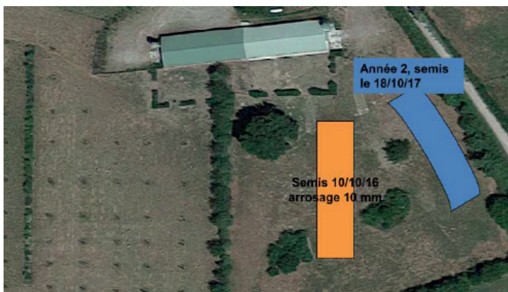
FIGURE 1 : Deuxième dispositif mis en place au lycée des Sicaudières. A gauche de la haie, le parcours « témoin », à droite de la haie le parcours « essai » FIGURE 1: Second setup implemented at lycée des Sicaudières. To the left of the hedge, the 'control' pasture; to the right of the hedge, the 'trial' pasture

Le protocole a été suivi sur 6 lots successifs de poulets. Les poussins ont été reçus à 1 jour, avec 2200 poussins par bâtiment. Ils ont eu accès au parcours à 40 jours, avec ouverture des trappes entre 6h00 et 9h00, fermeture entre 16h30 et 19h00 en fonction des saisons, et sont élevés jusqu'à 83 jours. Trois aliments ont été distribués aux animaux selon la période : démarrage, croissance et