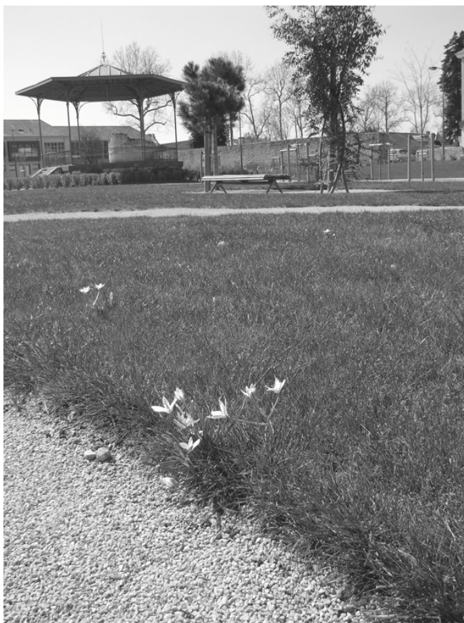
PHOTO 1 – Gazon ornemental en espace vert.