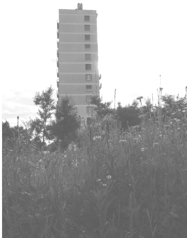
PHOTO 2 – Prairie fleurie en milieu urbain (crédit photographique : Plante & Cité).

Cependant, cette biodiversité parfois fortement mise en avant reste très artificielle et le fait de devoir ressemer pour garantir le fleurissement amène les gestionnaires à chercher des méthodes de