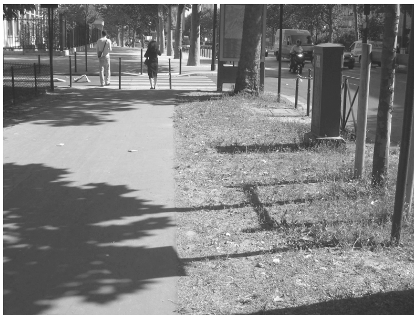
PHOTO 3 – Trottoir sablé enherbé.

L'exemple des surfaces sablées illustre bien les nouveaux aménagements et entretiens utilisés pour limiter les opérations de désherbage. Plutôt que de systématiquement désherber ces surfaces, plusieurs gestionnaires de services "espaces verts" ont décidé de laisser s'enherber ces espaces sablés, naturellement ou à partir d'un ensemencement initial. Les espaces sablés ont la caractéristique d'être des surfaces stabilisées, souples, adaptées à la marche. Leur relative perméabilité permet la végétalisation des pieds d'arbre et ce type de revêtement se trouve dans les allées de parcs, dans les aires récréatives ou espaces sportifs.