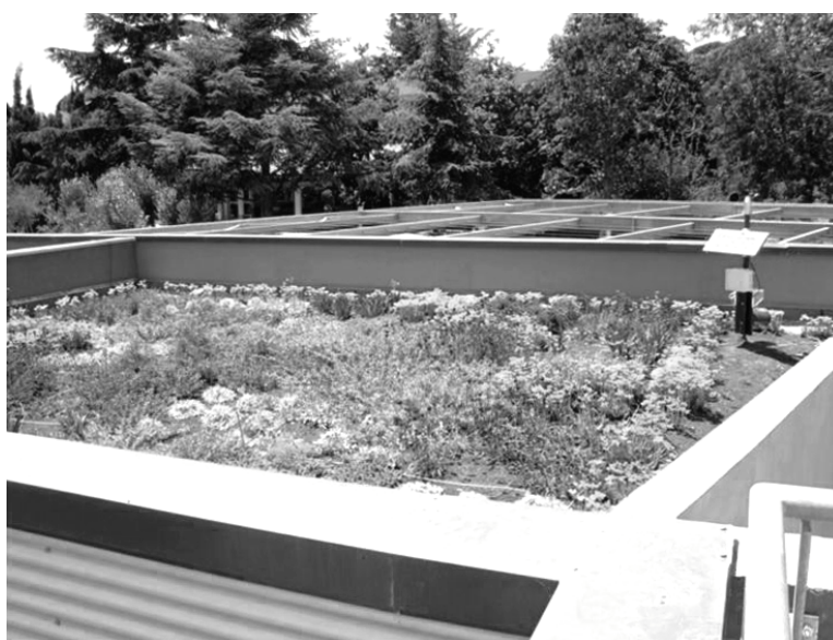
PHOTO 4 – Expérimentation de diversification végétale sur toiture végétalisée.

Les toitures végétalisées sont aussi perçues comme des supports possibles de biodiversité, et d'opportunité de création d'une composante de la trame verte, et ce tout particulièrement dans des espaces densément urbanisés. Des projets d'évaluation sont en cours pour les intégrer aux futures trames vertes.