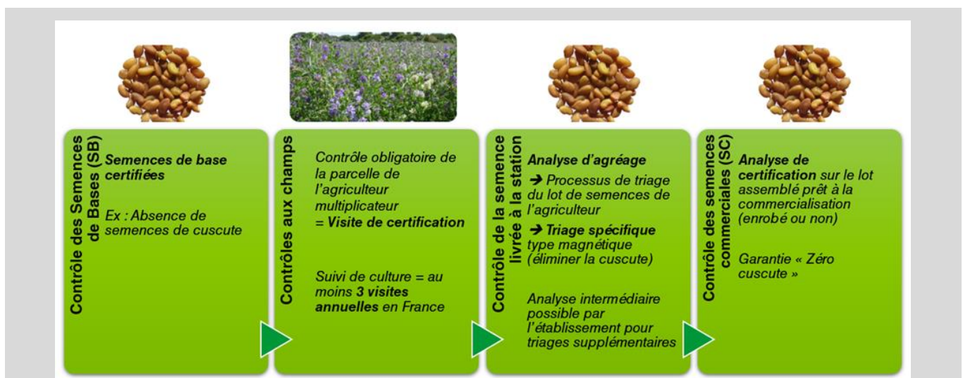
FIGURE 3 : Schéma type de contrôle des semences de luzerne de la semence de base à la semence commerciale (exemple d'un établissement semencier français) Figure 3 : Typical alfalfa seed control scheme, from basic seed to commercial seed (example of a French seed plant).

Après l'implantation, un suivi régulier est effectué par des techniciens agréés afin de vérifier la